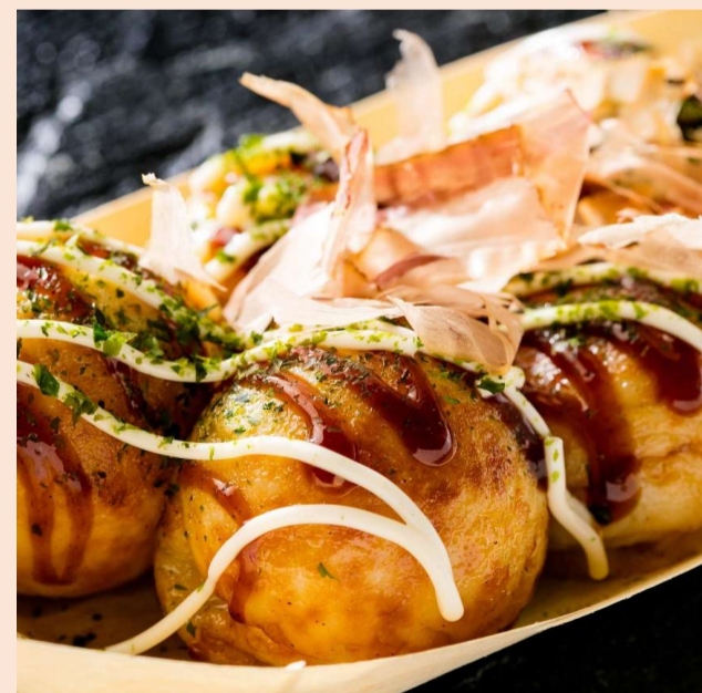
揚げたこ焼き 1パック : 500円