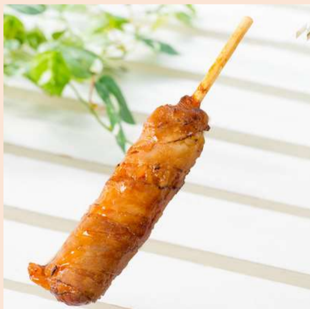
肉巻き棒 1本 : 500円