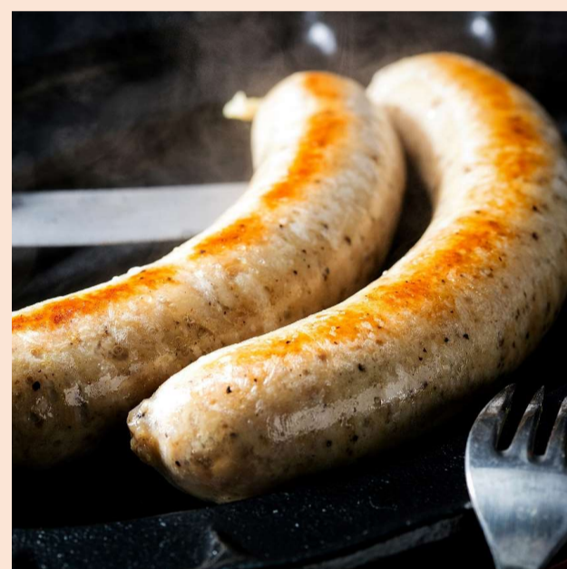
望来豚フランク 1本 : 500円