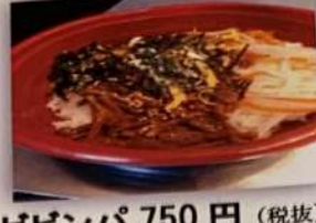
ビンパ 750円 (税抜)