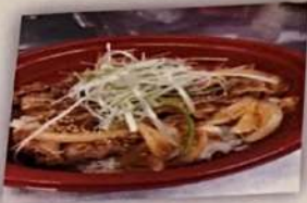
牛丼 680円 (税抜)