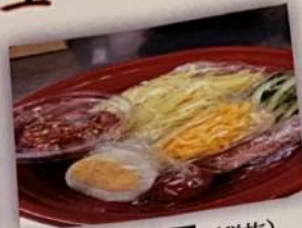
冷麺 780円 (税抜) (麺は2分茹でる)