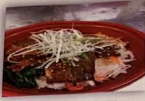
カルビビンパ 1,000円 (税抜)