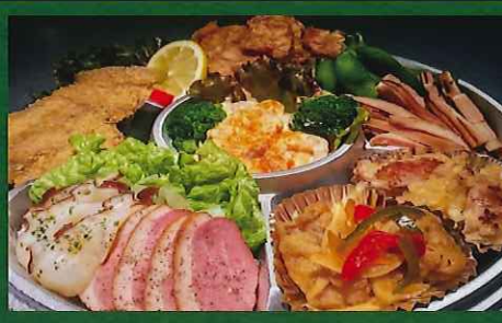
無国籍オードブルセット 4500円

みんなが集まれば、そこに パーティプレート&オードブル 人気の料理が盛りだくさん!