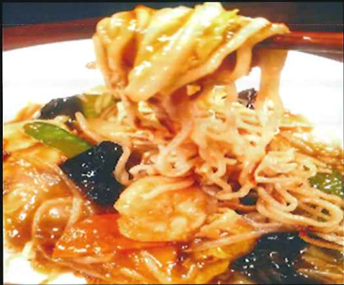
五目あんかけ焼そば