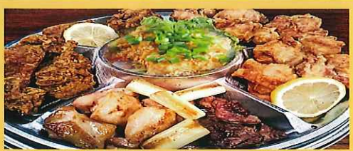
とり揚げ物プレート 3500円