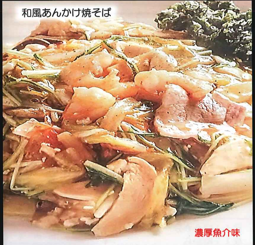
和風あんかけ焼そば