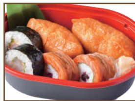
巻き寿司と稲荷寿司