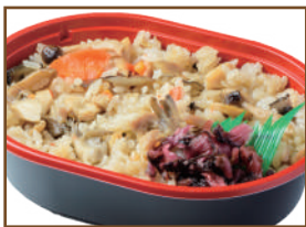
鶏と茸の炊き込み御飯

旬菜箱ご飯セットは、旬菜箱《和》又は《洋》いずれかを、下記より好きなご飯をおひとつお選びください。